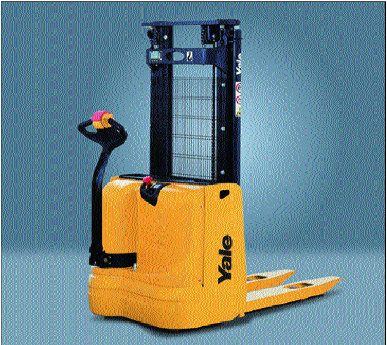
Der abgebildete Stapler enthält Sonderausstattungen.